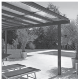
Glasdachsystem TERRADO GP5110

STOBAG AG Pilatusring 1 5630 Muri/AG Tel. 056 675 42 00 info@stobag.ch www.stobag.ch