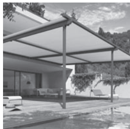
Terrassenmarkise PERGOLINO P3500

Der Verkauf und die Montage der STOBAG-Produkte erfolgt ausschliesslich über den Fachhandel. Buchen Sie jetzt Ihren persönlichen Beratungstermin bei Ihrem Sonnen- und Wetterschutzspezialisten oder besuchen Sie unsere Ausstellung in Muri.