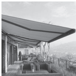
Kassettenmarkise TENDABOX BX3000